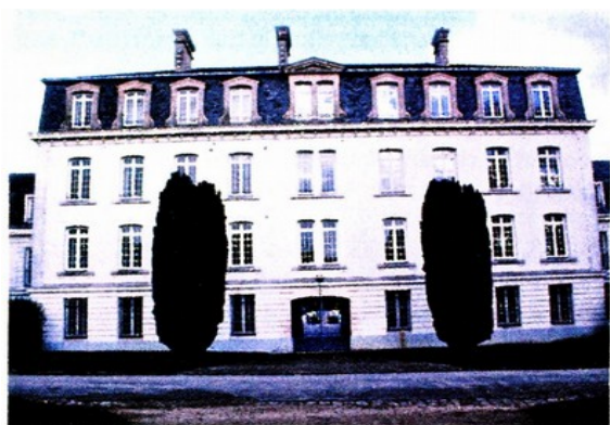
Les nouvelles écuries, actuellement le Quartier Estienne

Cet établissement, construit en 1786, pour " loger les écuyers, les pages, les piqueurs et palfreniers et placer trois cent trente deux chevaux " fut implanté à Groussay entre la principale avenue conduisant au château et le grand chemin de Paris à Chartres.