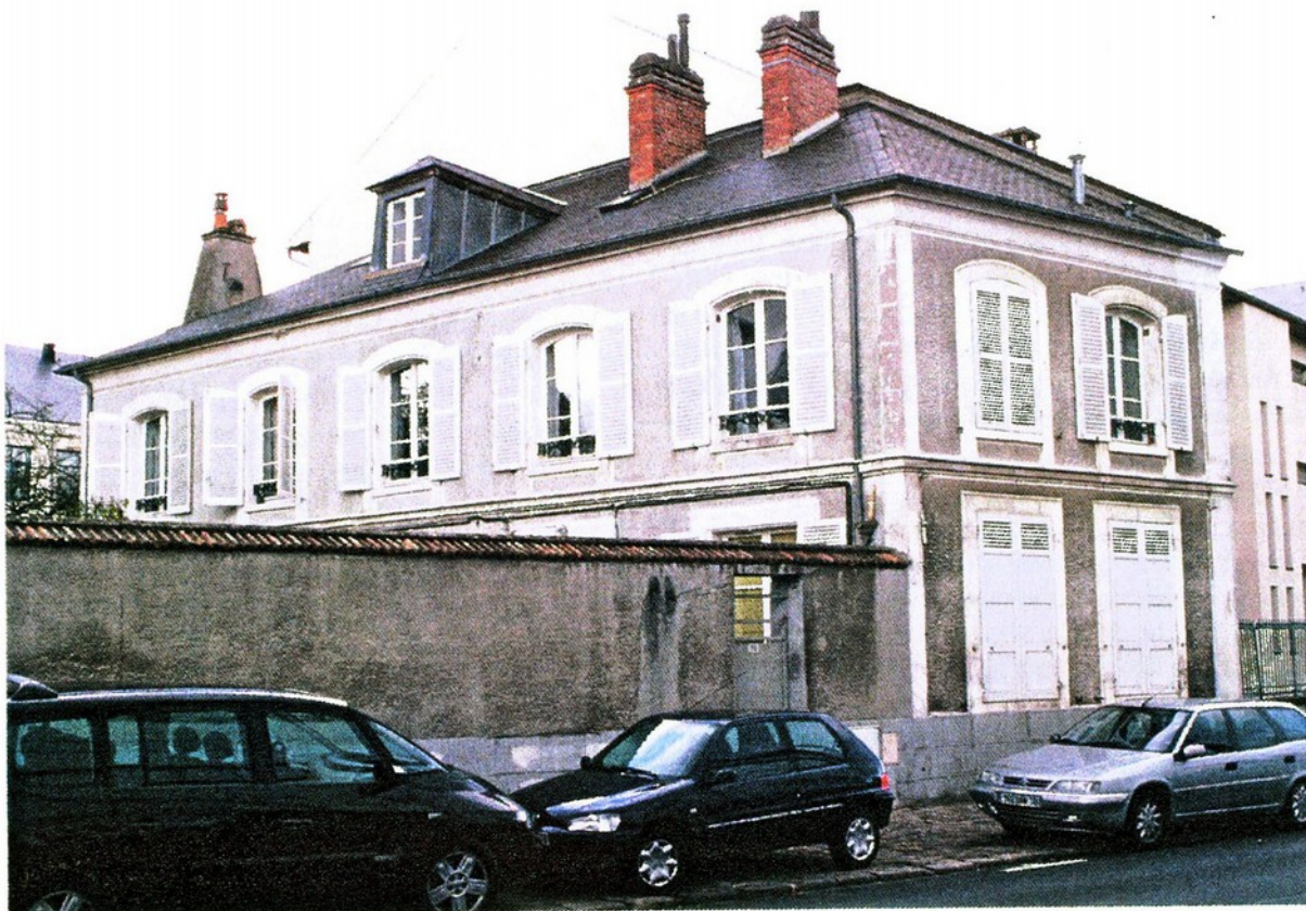
Maison Juliac

Jacques-Pierre Juliac, peintre-doreur des bâtiments du roi, demeurant à Paris, rue Notre-Dame-de-Nazareth, paroisse Saint-Nicolas-des-Chariips, travaillait sur les différents chantiers royaux à Rambouillet lorsqu'il acquit du Roi, par bail à cens, le 6 février 1787, un terrain de 450 toises, à Groussay, du côté du parc " à condition de construire un bâtiment 41