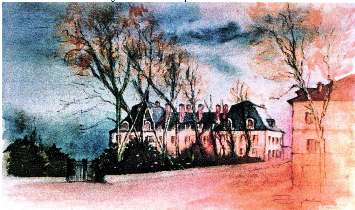
Les nouvelles cuisines, partie sud de l'actuelle caserne des gardes. Aquarelles de ICI. Apert - 1981

La partie sud du Corridor, une nouvelle fois remaniée, servira d'Ecole préparatoire d'infanterie entre 1875 et 1934 et sert actuellement de logement aux officiers supérieurs.