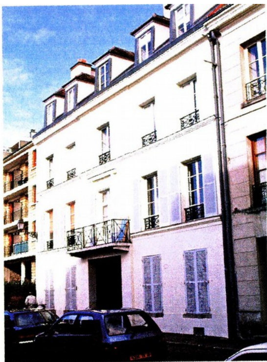
Immeubl Dablin père

Dablin père, Dablin l'aîné et Dablin le jeune furent tous les trois employés pour les travaux du roi ce qui leur permit de prendre le titre de " serrurier du roi ". Un état des réglemента des travaux exécutés pour le roi fait mention des sommes perçues par chacun : le père 4 965 livres, l'aîné 481 525 livres 19 sols 10 deniers et le jeune 4 979 livres 31 . L'exercice de leur métier permit aux deux premiers d'élever deux immeubles mitoyens, rue d'Angiviller.