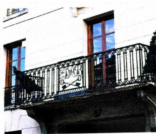
Immeuble Dablin fils

Jacques Dablin, acquit, le 12 février 1787, 29 perches (1479 m 2 ) de jardin sur la rue des Remparts (rue d'Angiviller) d'Edme-René de la Mustière, avocat au Parlement, ancien bailli de Rambouillet et de dame Jeanne Gaillard, moyennant 300 livres de rente foncière au principal de 6 000 livres plus 600 livres de pot-de-vin " à condition de faire bâtir sur ce terrain, dans les deux ans, des bâtiments propres à y demeurer 33 »